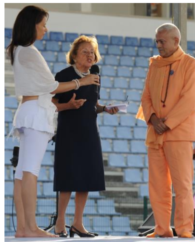
A Poesia e a Dr.ª Maria Barroso

O Arquitecto Siza Vieira e a Dr.ª Maria Barroso, foram algumas das personalidades nacionais que marcaram presença neste evento, apoiado também por outras prestigiadas entidades, como a Câmara Municipal de Lisboa, a Embaixada da Índia em Portugal, a Fundação INATEL, o Comité Olímpico de Portugal, o Alto Comissariado para a Imigração e Diálogo Intercultural, a Fundação Oriente, Fundação Pró Dignitate, Fundação da Juventude, o Instituto Português da Juventude, CP – Comboios de Portugal, Turismo de Lisboa e a Comunidade Hindu de Portugal, entre outros.