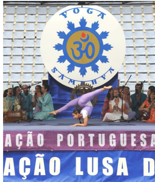
O Yoga Avançado do PASHUPATI

Candidato na UNESCO a Primeiro Feriado Mundial (comemorado ao Domingo) – no Solstício, Junho 21, este Dia pela Fraternidade Mundial, Inter Étnica, Inter Cultural e Inter Religiosa, e por 24h sem derramamento de sangue, contou com a participação e apoio dos principais Mestres do Yoga da Índia, EUA, Canadá, Norte de África, Egito, e Europa – França, Espanha, Itália, Inglaterra, Holanda, Bélgica, Grécia, Suíça, Alemanha, e de Portugal, assim como dos representantes das principais Religiões do Mundo, entre outras individualidades.