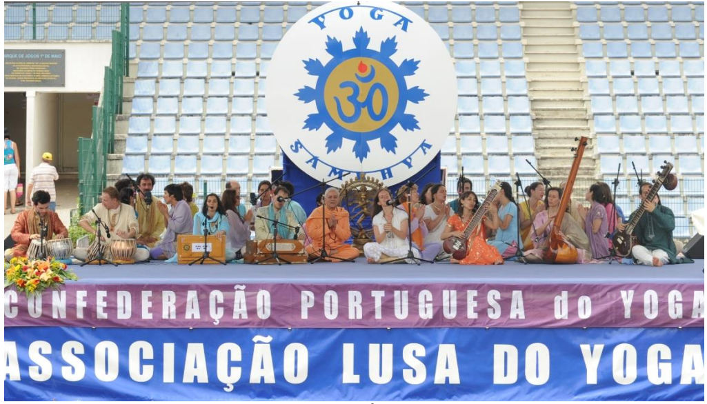
Os Mantra / Kirtana do Coral Orquestra OMKÁRA da Confederação Portuguesa do Yoga