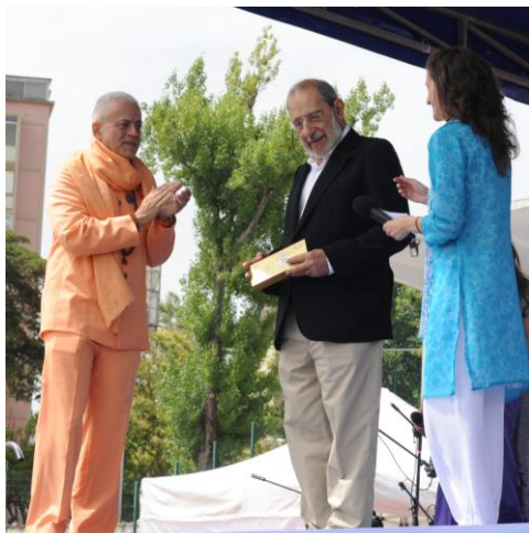
Homenagem ao Genial Arq.º Siza Vieira

Candidato na UNESCO a Primeiro Feriado Mundial (comemorado ao Domingo) – no Solstício, Junho 21, este Dia pela Fraternidade Mundial, Inter Étnica, Inter Cultural e Inter Religiosa, e por 24h sem derramamento de sangue, contou com a participação e apoio dos principais Mestres do Yoga da Índia, EUA, Canadá, Norte de África, Egito, e Europa – França, Espanha, Itália, Inglaterra, Holanda, Bélgica, Grécia, Suíça, Alemanha, e de Portugal, assim como dos representantes das principais Religiões do Mundo, entre outras individualidades.