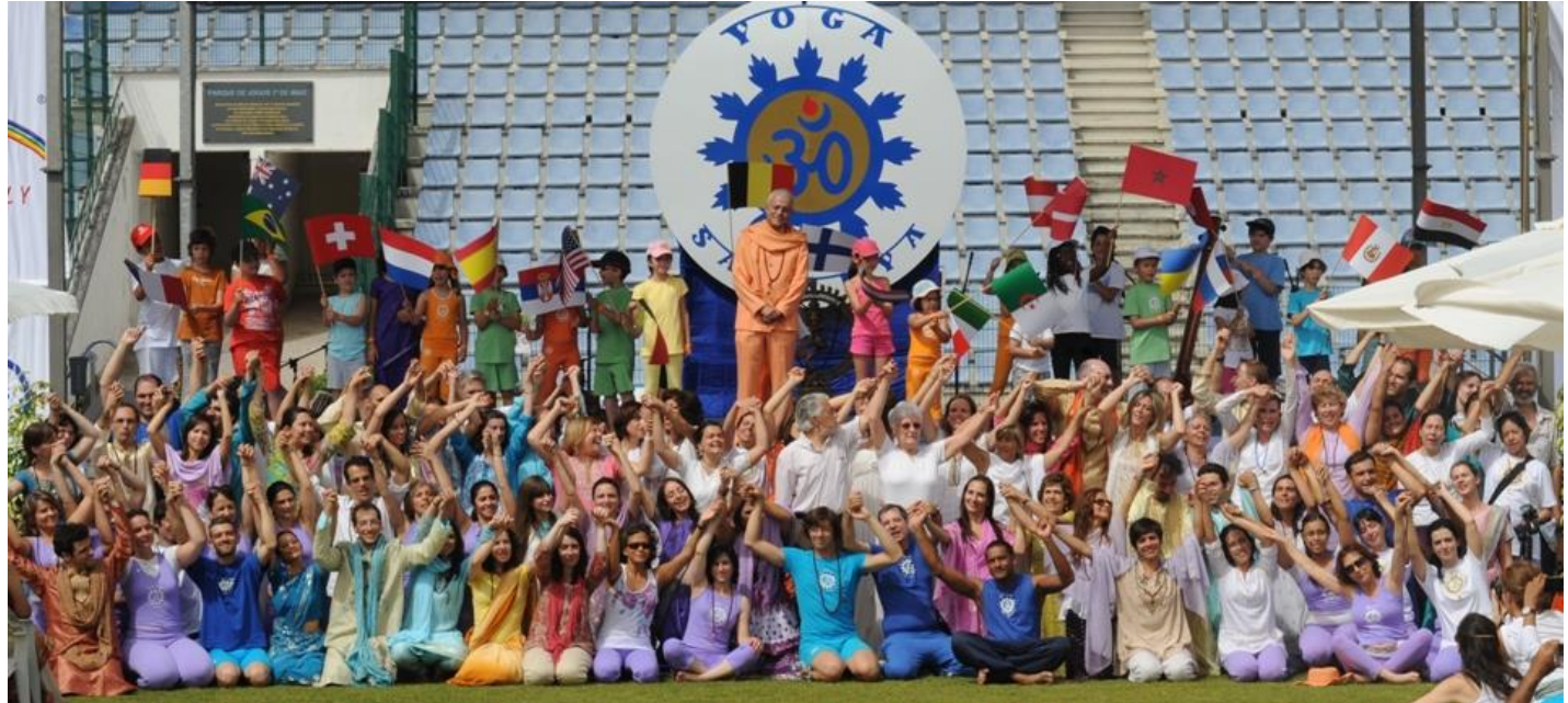
A Abertura do DAYMUNDY, os Professores da Confederação Portuguesa do Yoga, e de Portugal, as crianças, o Mundo, e o Futuro

O International Day of Yoga - IDY / Dia Internacional do Yoga é um Candidato precursor junto às Nações Unidas e UNESCO a Primeiro Feriado Mundial celebra-se num Auspício Cósmico – Supra Cultural – um Solstício – Junho, 21 – (comemorado sempre no Domingo seguinte quando não coincidente).