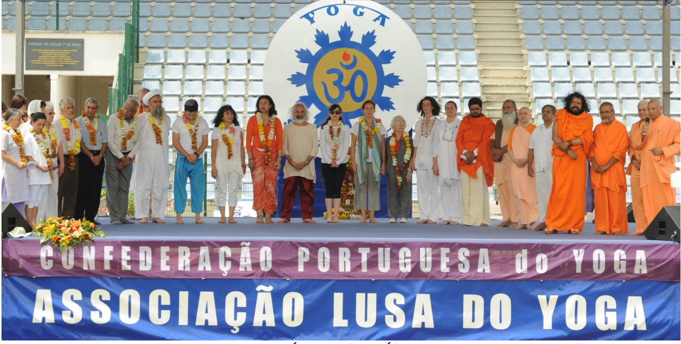
Todas as Escolas do Yoga em Palco – Índia, Américas, África e Europa com Portugal incluído