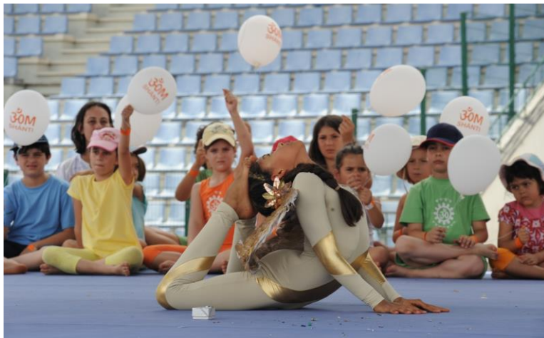
Yoga para Crianças – pela defesa dos valores humanitários e activação da capacidade mental humana