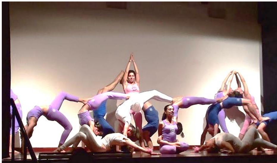
Apresentação do PASHUPATI – IN THE BEGINNING