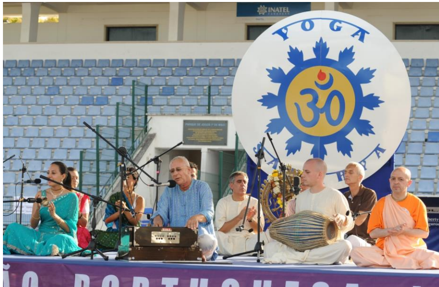
A intervenção da Escola do Yoga convidada - ISKCON - Movimento Hare Krishna Internacional