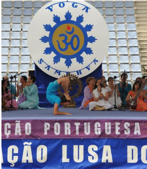
PASHUPATI e OMKÁRA em palco