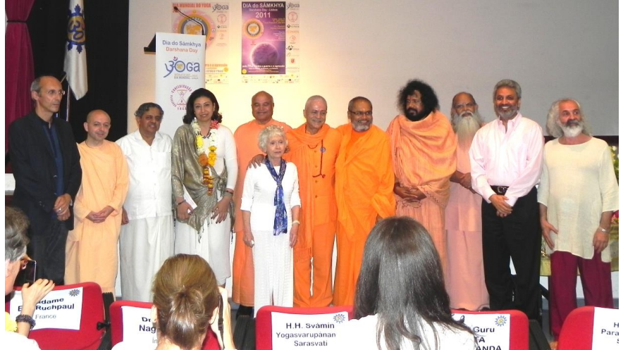
Oradores do Dia do Sámkhya e do Darshana