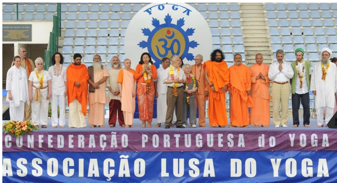
Alguns dos Grandes Mestres Mundiais do Yoga presentes no DAYMUNDY 2011 - Lisboa