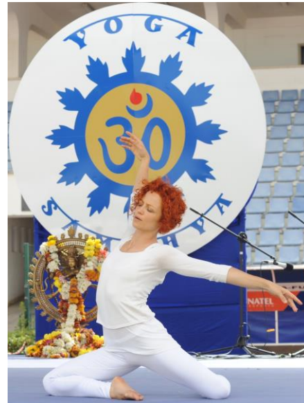
A Ave Maria de Gounod pela 1ª Bailarina do Ex-Ballet Gulbenkian