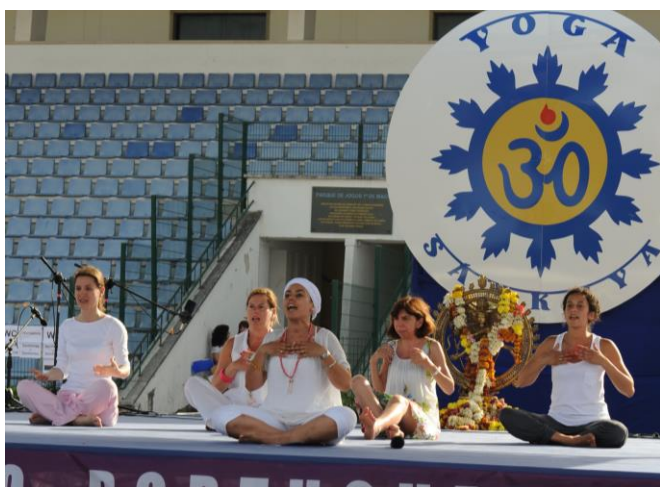
Práticas das Escolas do Yoga convidadas – o Kundalini Yoga