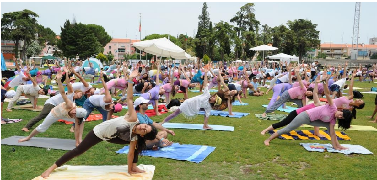
Mais de 1100 praticantes no International Day of Yoga - IDY / Dia Internacional do Yoga – 2011 em Lisboa, praticando a Super Sequência dos Ásana - Purusha Namaskára

Organização da CONFEDERAÇÃO PORTUGUESA do YOGA, com o apoio da CÂMARA MUNICIPAL DE LISBOA, FUNDAÇÃO INATEL e COMITÉ OLÍMPICO DE PORTUGAL